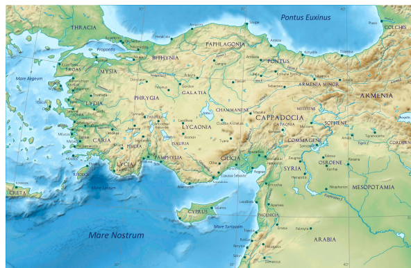
Figur 1 Galatien på romersk tid (i dagens centrala Turkiet) 1

Galatien var en provins i Romarriket. Området låg i nuvarande centrala Turkiet. Galat är samma ord som vårt nuvarande ord kelt. Galater var kelter; det fanns keltiska stammar från de brittiska öarna i väst till Galatien i öst.